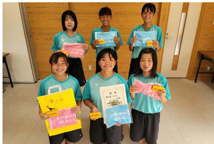
第3位 小松島市立 小松島中学校