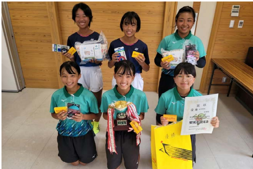
優勝 阿南市立 阿南第二中学校