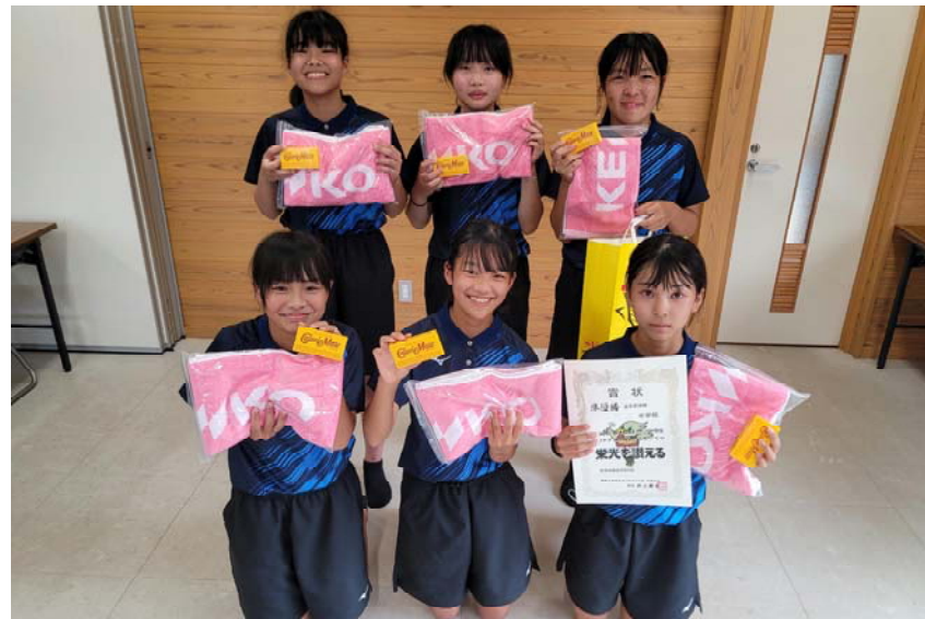
準優勝 阿南市立 阿南中学校