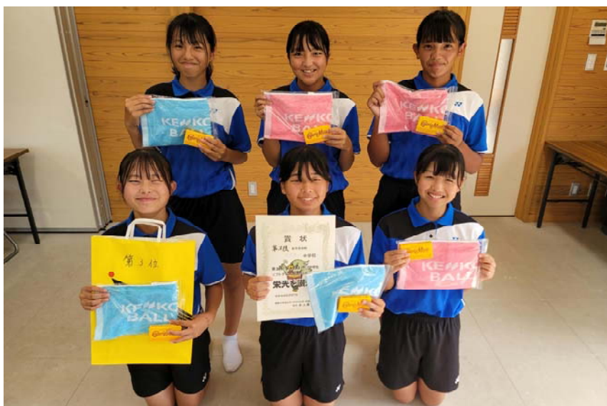
第3位 阿南市立 阿南第一中学校